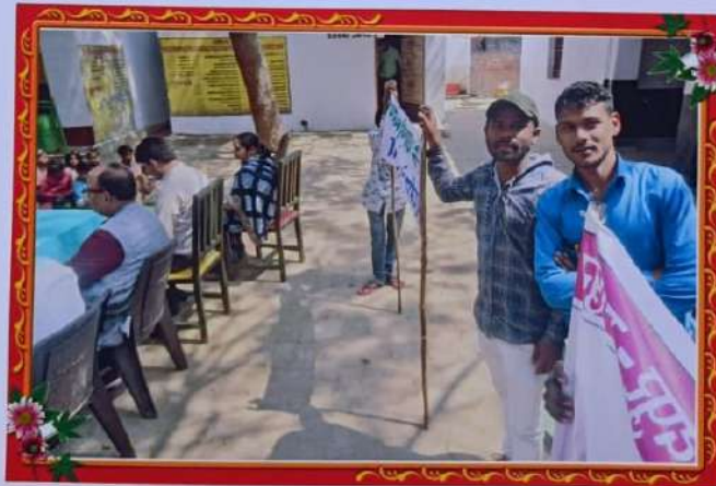
महाविद्यालय के प्रवक्तागण प्रा0वि0 के बच्चों को जागरुक करते हुए।

सर्वप्रथम अधिकारी (रा०से०पी०) महात्मा गाँधी शती स्मारक महाविद्यालय