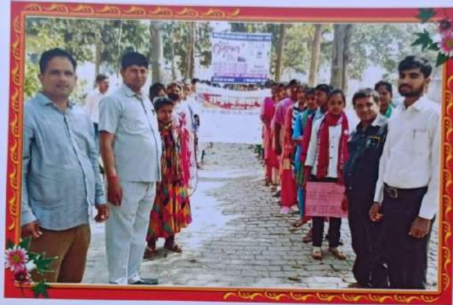
प्रातःकालीन सत्र, छात्र-छात्राओं को गाइड करते महाविद्यालय के प्रवक्ता।