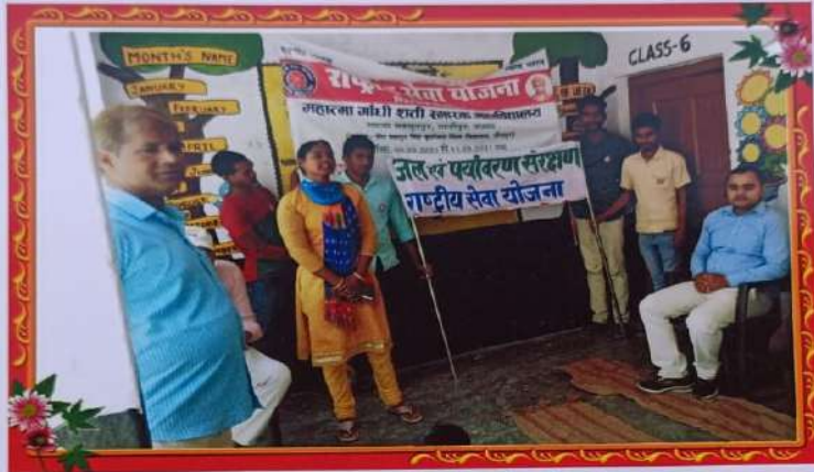
जल एवं पर्यावरण संरक्षण पर अपने विचार प्रस्तुत करती महाविद्यालय की प्रध्यापिका

कार्यक्रम अधिकारी (ए०से०यो०) महात्मा गांधी शती स्मारक महाविद्यालय गरुआ, मकसुदपुर-गाजीपुर