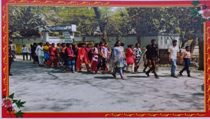
प्रभातफेरी करते शिविरार्थी ।